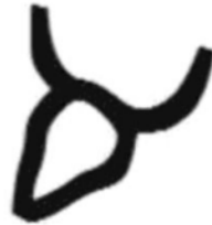
Буква палеоалфавита “Алеф”.